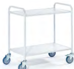
Bürowagen 2 Etagen