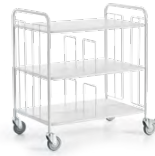
Bürowagen doppelseitig m. Trenngittern