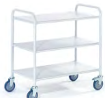
Bürowagen 3 Etagen